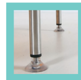
5 ventouses transparentes