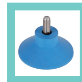
Ventouses spéciales inox et petites mosaïques