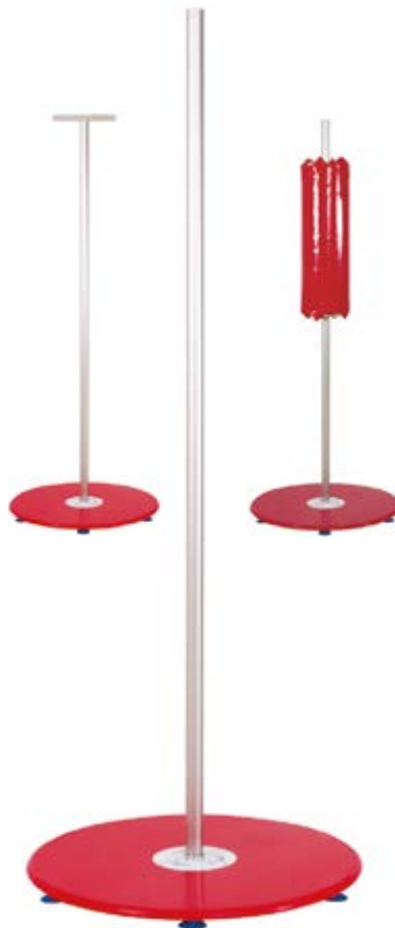
AFA POL ELAS