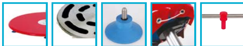
Base en polyéthylène AFA POL 0001