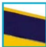
Tapis caoutchouc double épaisseur